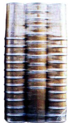
72 konische Fässer