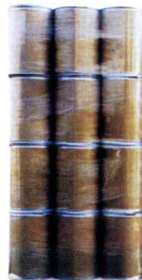
24 zylindrische Fässer