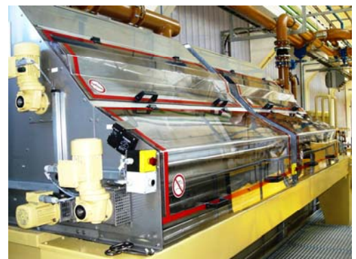
Filter für Endlosband und Filtervlies mit motorischer Schmutzvliesaufwicklung